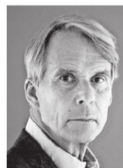
Dick Berlijn

Rusland zal nu successen willen laten zien. Dat zou een flinke opkikker geven. Maar we weten gewoon niet of deze reservisten straks wél bereid zijn te vechten.’