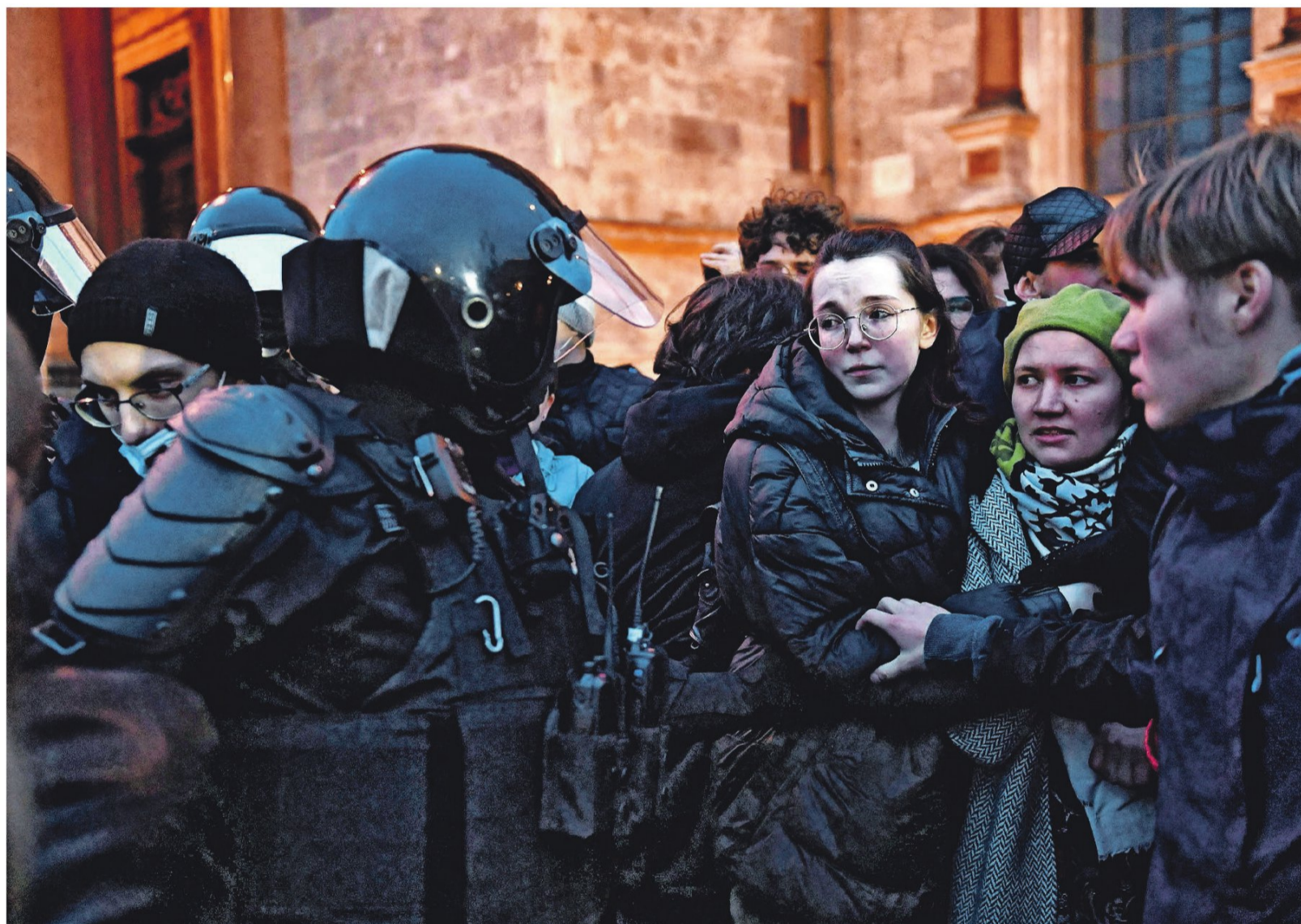
Agenten traden hard op tegen demonstranten die woensdag in Sint-Petersburg protesteerden tegen de aangekondigde mobilisatie.

‘Het Russische leger heeft nu slagkracht en goed gemotiveerde soldaten nodig. Dus artilleristen, tankbemanningen, meer gevechtshelikopters en gevechtsvliegtuigen. Het is nog maar de vraag of het moreel van de opgeroepen reservisten hoger